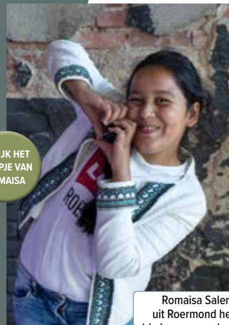
BEKIJK HET FILMPJE VAN ROMAISA

In een Kies&Co kinderradi werken kinderen van plan naar resultaat, samen met mensen en organisaties die daar expertise en middelen voor hebben.